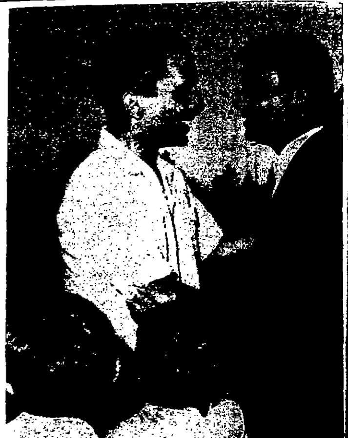
جلالة الملكة الملكة سيشيل سيمو الجرحى من ولي العهد المقدم لدى وصوله الى مطار عمان قادما من لندن

سمو ولي العهد عاد من لندن عمان - كان جلالة الملكة الحسن المقدم في استقبال سمو الجرحى من ولي العهد المقدم لدى عودته مساء امس الى عمان قادما من لندن . كما كان في استقبال سموه في مطار عمان دولة السيد بيجت القنولي رئيس الوزراء والوزراء وسيدة الشريف حسين بن ناصر رئيس الديوان الملكي الهاشمي وكبار رجال الدولة والجيش والامن والمقام الملكي.